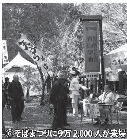
⑥そばまつりに9万2,000人が来場