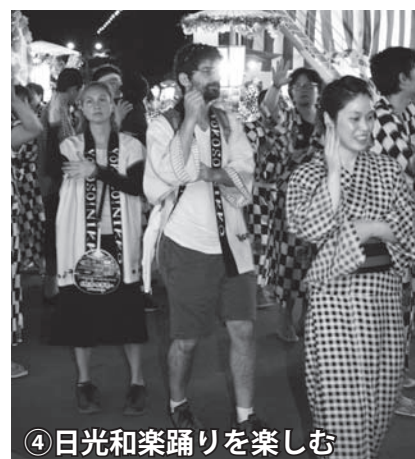
④日光和楽踊りを楽しむ