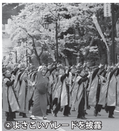
②よさこいパレードを披露