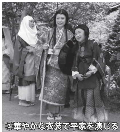
③華やかな衣装で平家を演じる