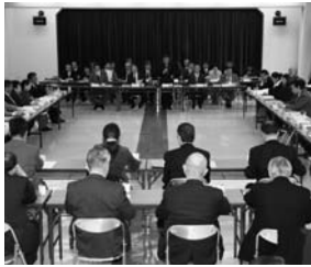
栗山村で行われた、最後の合併協議会。平成15年10月の設置以来、約2年半の間に32回の協議会が開催された。