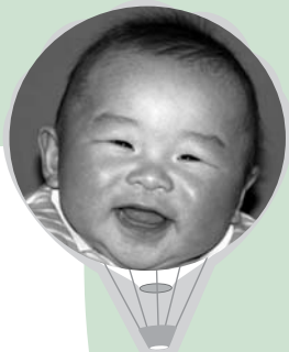
ふくしま そら 福島 青空くん 5か月・鬼怒川温泉大原