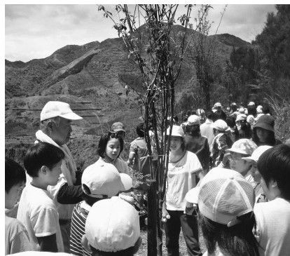
説明を受けながら植樹している様子

今年から授業の一環として、地域の伝統芸能である銅太鼓を取り入れました。6年生全員が地域の方の指導の下、一生懸命練習しています。