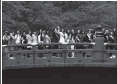
神橋に勢ぞろいした各国代表

10月13日(木)、「2016ミス・インターナショナル世界大会」に出場する世界70カ国・地域の代表が日光市を訪れました。