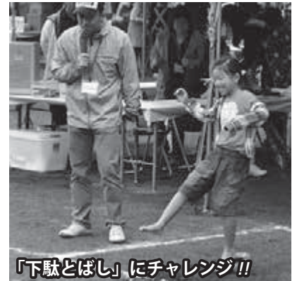
「下駄とばし」にチャレンジ!!

10月8日(土)、毎年恒例の「日光けっこうフェスティバル」が日光運動公園で開催されました。