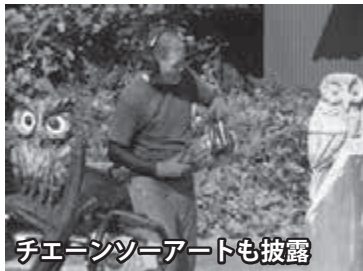
チェンソーアートも披露