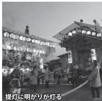
提灯に明かりが灯る

今市屋台まつり 10月16日(日)、JR今市駅前通りで今市屋台まつりが開催されました。当日は好天に恵まれ、お祭り日和となりました。駅前通りには、江戸時代に作られたものもある精巧な彫刻を施した彫刻屋体6台と、紅葉などで鮮やかに飾られた花屋体4台が繰り出されました。 日が傾くと、それぞれの屋台の提灯に明かりが灯り、訪れた方は