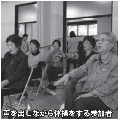
声を出しながら体操をする参加者

ちよきんアップ体操 10月15日(土)、女性サポートセンターで「日光ちよきんアップ体操」が行われました。 平成27年度の「地域づくり・介護予防」モデル事業に清滝地区が選定され、現在も住民主体で週1回行われています。 参加者からは「体操の効果が実感でき、仲間と集う場ができてうれしい」という声が聞かれました。