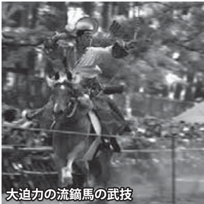
大迫力の流鏝馬の武技

ちよきんアップ体操 10月15日(土)、女性サポートセンターで「日光ちよきんアップ体操」が行われました。 平成27年度の「地域づくり・介護予防」モデル事業に清滝地区が選定され、現在も住民主体で週1回行われています。 参加者からは「体操の効果が実感でき、仲間と集う場ができてうれしい」という声が聞かれました。