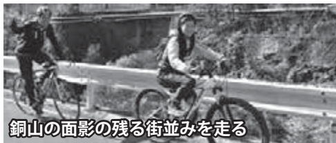
銅山の面影の残る街並みを走る

11月6日(日)、足尾地域でサイクリングイベント「ふおたりんぐ in 足尾」が行われました。このイベントは、足尾地域を自転車で走りながら撮影した写真によって点数を競うもので、2年前に始まりました。平成27年は残念ながら悪天候で中止になってしま