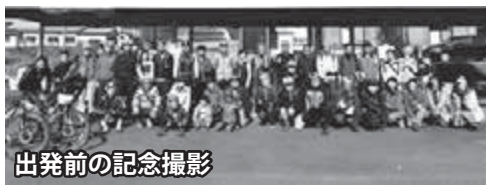
出発前の記念撮影