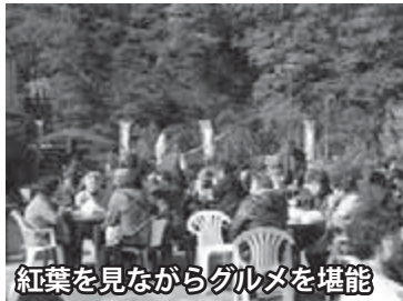
紅葉を見ながらグルメを堪能