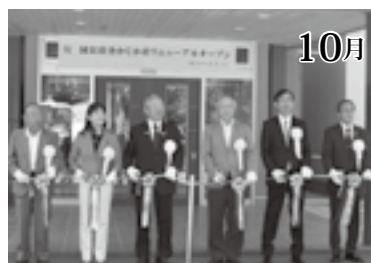
新しいかじか荘がオープン