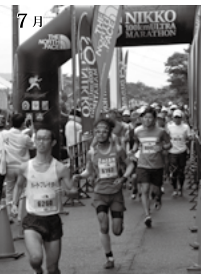
初開催の日光ウルトラマラソン