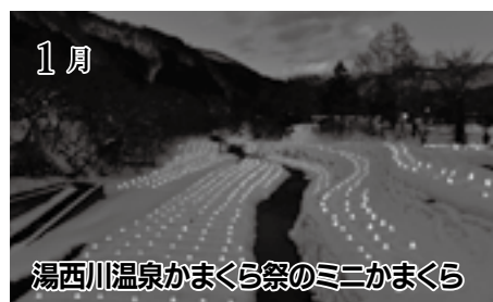
湯西川温泉かまくら祭のミニかまくら