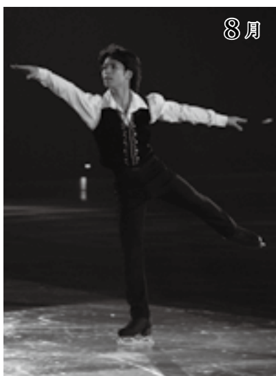
見事な演技(プリンスアイスワールド)