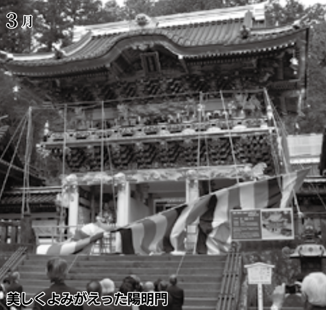
美しくよみがえった陽明門