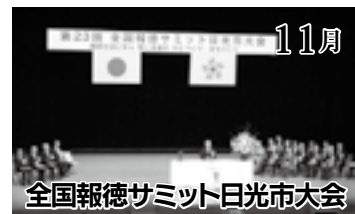
全国報徳サミット日光市大会