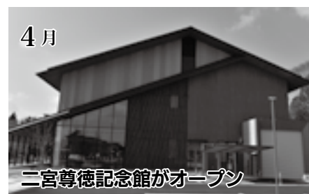
二宮尊徳記念館がオープン