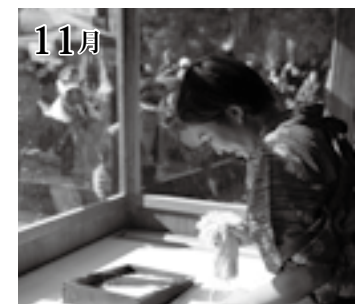
9万人が来場。日光そばまつり