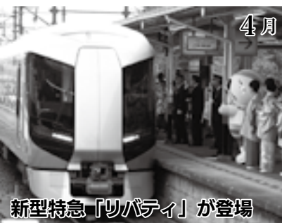
新型特急「リパティ」が登場