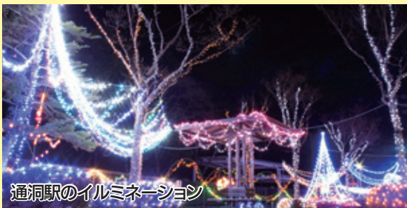
通洞駅のイルミネーション

現在、足尾では、「わたらせ渓谷鐵道」の各駅で冬を彩るイルミネーションが点灯しています。協力隊は、色鮮やかな電飾を通洞駅に飾り付けました。このイルミネーションは、2月28日(水)まで楽しむことができます。 皆さん、ぜひお越しください! なお、夜はとても冷えまますので暖かい服装で来てくだいね。