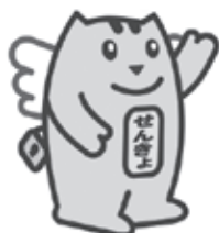
明るい選挙のイメージキャラクター 選挙のめいすいくん

詳しくは、今月号と同時配布の「選挙のお知らせ」または、市ホームページをご覧ください。