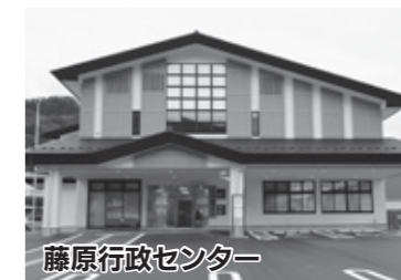
藤原行政センター