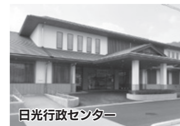
日光行政センター