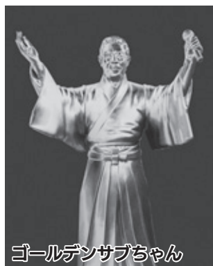
ゴールデンサブちゃん