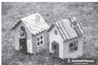
出来上がりイメージ (寸法：約16×12×12cm)