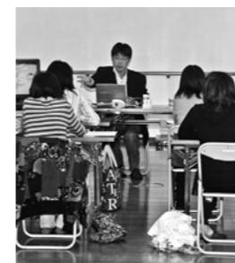
ママのミニ学習会の様子