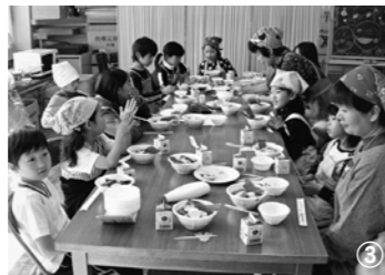
メニューはビーフシチューやワンタンスープ。どれもおいしいぞ!

❖ひいらぎまつり❖ 毎年、学校の創立記念日の11月13日に行われるお祭りです。ひいらぎまつりでは、児童たちが農園で収穫した野菜をふんだんに使い、縦割り班ごとにいろいろな料理を作ります。献立も自分たちで考え、教室の中もきれいに飾りつけをします。そして、保護者や近所の方たち、スクールガードなど日ごろお世話になっている方たちを招待し、みんなで楽しく食事をします(写真③)。 午後には、体育館で学習発表会が行われます。学年ごとに劇やダンスなどの発表をするほか、全校児童による合唱や合奏、ブラスバンド部による演奏も行われ、とてもぎやかな1日になります。