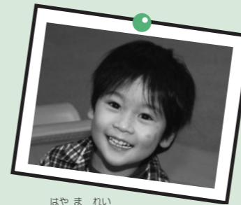
早間 嶺 くん 4歳・森友