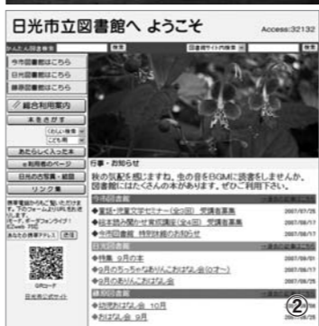
①左から、図書館通信、あたらしく入った本(一般用)、ブックランド ②情報満載の図書館ホームページ

すので、どうぞご利用ください。また、図書館のホームページ(http://lib.nikcity.jp/)でも、各図書館の行事や利用案内、新着図書を紹介していますので、ぜひご覧ください。