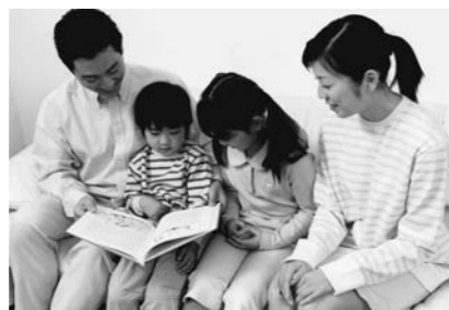
家族で楽しむ絵本。ページをめくるたびに、すてきな世界が広がります。

「借りるのは主に、子どもの本やビデオです。藤原図書館にある検索機で借りたいものを探しています。今市・日光図書館にある本などを藤原図書館で借りることができ、また返却もできるので大変便利ですね」。