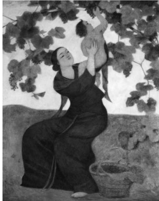
小杉未醒「母子採果」 1925(大正14)年頃 油彩・カンヴァス、額装 116.0×90.3cm ヒノギヤラリー所蔵 ※未醒は、放菴の前に使っていた画号です。

会 期：10月20日(土)～12月2日(日) 開館時間：午前9時30分～午後5時 ※入館は午後4時30分まで 休 館 日：会期中は無休 入 館 料：一般…700(300)円 大学・高校生…500(200)円 小・中学生…300(100)円 ※( )内は市民割引券を利用した際の料金