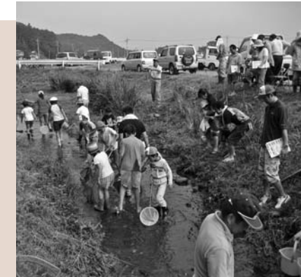
生物の生息状況の把握 (塩野室地域水土里保全隊)