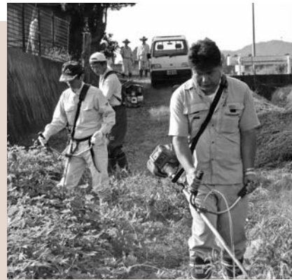
水路の草刈り (沢又地域ふるさと資源保全隊)