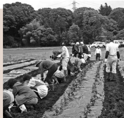
景観形成のための施設への植栽 (岩崎自然環境保全会)

市では今年4月、教育委員会に近代史や建築史の専門家などで構成する検討委員会を設置しました。その中で、足尾銅山の産業遺産の評価を重ねた結果、世界遺産としての価値があるものとの考えに至りました。そして、世界文化遺産国内暫定一覧表へ追加記載するため、県と共同で提案書を文化庁へ提出しました。 足尾銅山は、明治以降の日本の近代化と産業化に大きく貢献しました。同時にその歴史は、日本で初めて社会問題化した公害と、その対策の歴史でもありました。世界的にみても、鉱業の発達とそれに伴う環境破壊と公害への対策の経緯といった視点で評価された世界遺産はなく、足尾銅山は極めてまれな事例です。