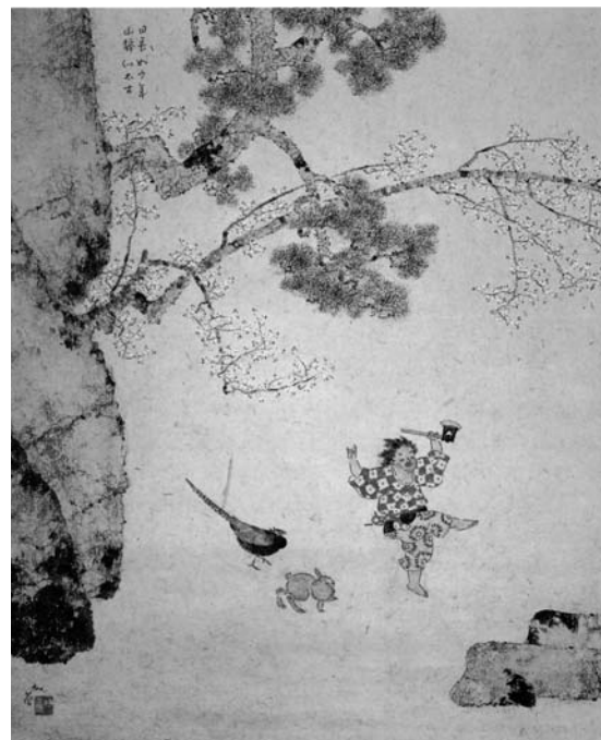
小杉放菴「金太郎」 紙本・着色、軸装 65.5cm×54.0cm 小杉放菴記念日光美術館所蔵