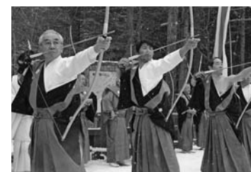
文・写真：秘書広報課

武射祭 1/4 日光 中禅寺湖畔にある二荒山神社中宮祠で行われた武射祭。雪が降りしきる中、宮司や神官、弓道愛好家の方たちが「ヤー!」というかけ声とともに、境内の上神橋から赤城山に向けて、矢を放ちました。この矢を拾った多くの見物客が、札所で災難除けの開運御守をつけ、た破魔矢にしてもらい、持ち帰っていました。 文・写真：秘書広報課