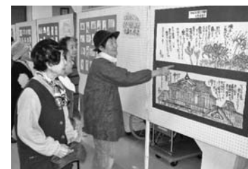
文・写真：男女共同参画課

女性サポートセンター 作品展示・発表会 12/4~12/14 日光 女性サポートセンターで開催された、センターの講座受講者や活動グループによる作品展示・発表会。絵手紙や写真、パッチワーク、手編み作品など約100点が展示されました。8日には、大正琴の演奏やジャズダンスの発表などが行われ、来場者は楽しい一日を過ごしました。 文・写真：男女共同参画課