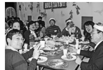
文・写真：市国際交流協会

国際交流パーティー 市内在住の外国人の皆さんを交えて、中央公民館でパーティーを開催しました。約90名が参加し、クリスマス飾りを作ったり、サンタのひげゲームなどで楽しく遊んだりした後、国際交流協会会員による手作りのクリスマス材料をいただきました。子どもから大人まで、楽しいひとときを過ごしました。 文・写真：市国際交流協会