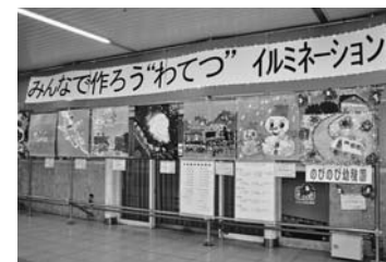
文・写真：足尾総合支所総務課

わたらせ渓谷鉄道各駅イルミネーション事業 2/24まで 足尾 2月24日まで行われているわたらせ渓谷鉄道各駅イルミネーション事業。沿線の保育園や幼稚園、学童クラブの協力で、子どもたちが製作したイルミネーション作品を桐生駅・相老駅・大間々駅・中野駅・足尾駅に展示しています。ぜひ、子どもたちの力作をご鑑賞ください。 文・写真：足尾総合支所総務課