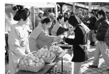
文・写真：鬼怒川・川治温泉観光協会

ゆず湯風呂キャンペーン 12/8・9 藤原 鬼怒川・川治温泉では、すべてのホテルや旅館、入浴施設をゆず風呂にし、お客さまの健康を祈願しました。9日には、鬼怒川温泉駅前広場で女将や芸者たちがけんちん汁とお土産のユズを2千名に配布しました。心のこもった温かいサービスに、鬼怒川・川治温泉を訪れた人たちは笑顔からほれていました。 文・写真：鬼怒川・川治温泉観光協会