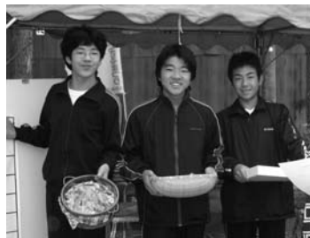
文・写真：三依地域活動委員会

その試食品を、三依地域活動委員会が全面的に協力し、9月28日(日)に開催された「山のもの何でもござるまつり」の会場で提供しました。ケーキは、大好評でした。