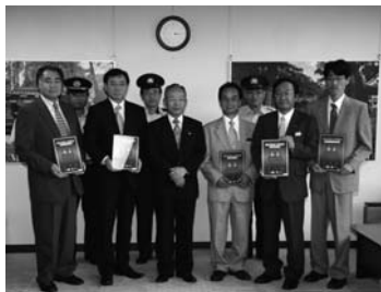
文・写真：消防本部総務課

4月1日から施行された「日光市消防団協力事業所表示制度実施要綱」に基づき、申請のあった市内6事業所に対し、日光市長より表示証の交付を行いました。この表示証は、消防団員の確保や消防活動がしやすい環境づくりに協力していただける事業所に対して交付するもので、この機会に更なる協力を依頼しました。