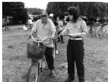
文・写真：杉の沢自治会

8の字運転や交差点の走り方、踏切の渡り方などに全員が真剣に取り組みました。終了後には、受講の証しとして自転車免許が配られ、参加者たちは安全運転を誓いました。