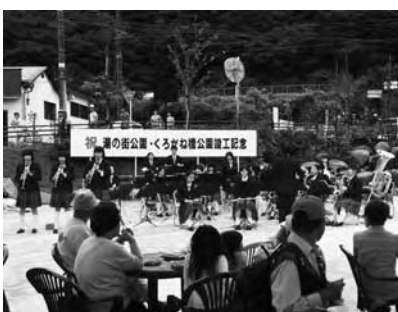
藤原中学校吹奏楽部の演奏の様子。

式典終了後には、記念イベントも開催され、会場を訪れた人へ焼きそばやうどん、お茶などが振る舞われました。また、地元の藤原中学校吹奏楽部の演奏や龍王太鼓なども行われ、多くの人でにぎわいました。