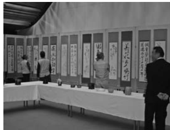
文・写真：中央公民館

会場を訪れた人たちは、展示されたそれぞれの力作に感心しながら、熱心に鑑賞していました。