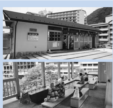
くろがね橋公園内に整備した、鬼怒子の湯(足湯)。