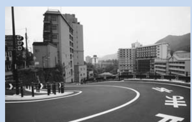
鬼怒川温泉通りとの交差点。

公園内には、鬼怒子の湯(足湯)もありますので、お越しになった際にはぜひご利用ください。 くわしくは 藤地域再生推進課 ☎(76)4112