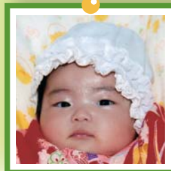
た た かは し み み く 高 た 橋 はし 美 み 玖 く ちゃん 8か月・下の内