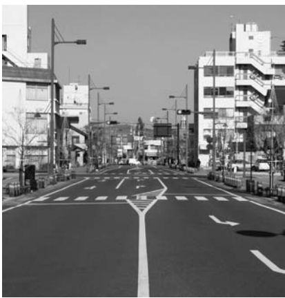
JR今市駅~国道119号間の道路の様子。

区域内に5路線の都市計画道路が新設・拡幅されました。総延長は1,406m、幅員は8~20mの街路および歩行者専用道路で、一部の街路では電線類の地中化も行いました。拡幅されたJR今市駅から国道119号までの都市計画道路では、市民有志団体による毎月の「六斎市」や、地元商店街などによる冬のイルミネーション点灯など、にぎわいのあるイベントが開催されています。