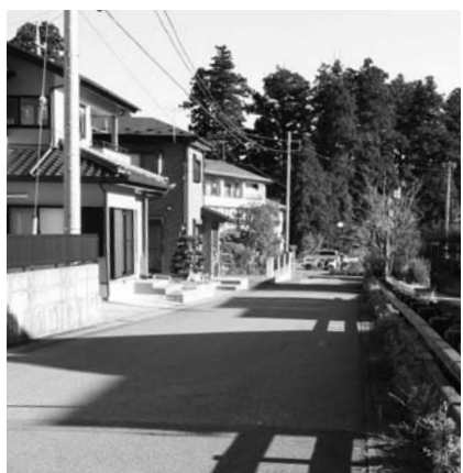
車がすれ違うことも可能な道幅です。

区域内に、総延長5,072mにおよぶ区画道路が整備され、すべての土地が道路に接しました。車が通れない狭い道路や、道路に接していないために家屋の建築ができなかった土地がすべて解消したことで、良好な居住環境が確保されました。