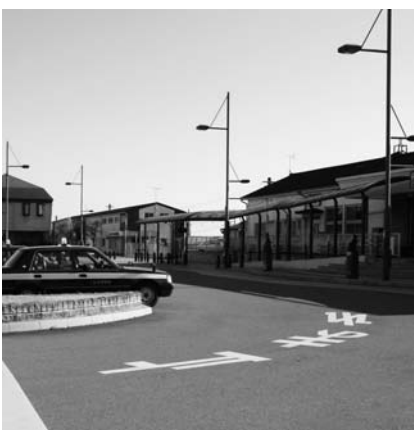
駅前広場の道路は一方通行です。

JR今市駅前は、バスやタクシーの待機所やミニ公園もある駅前広場となり、自転車駐輪場も設置されるなど、市の玄関口として整備されました。