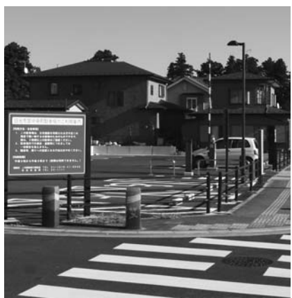
中央町駐車場は無料です。

今市図書館斜め向かいに、駐車台数22台(うち障がい者用2台)の「中央町駐車場」が整備されました。買い物など短時間利用者のための駐車場で、午前9時から午後9時まで無料で利用できます。