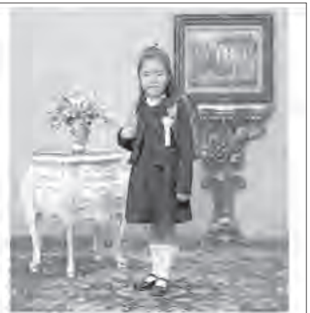
東野写真館 日光市今市361番地 TEL.0288-21-0348