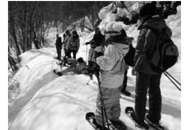
文・写真：落合支部子ども会連絡協議会

雪林スノーシュー体験 2/20 栗山 落合地区と三依地区の交流事業として、湯西川温泉かまくら祭り会場近くの雪林でスノーシュー体験を開催しました。スノーシューは大人から子どもまで利用可能な雪上歩行具で、参加者の多くが初めての体験でした。 深雪の中を進むと、シカやリスの足跡が見ることができ、雪林に住む生物の息吹を感じました。