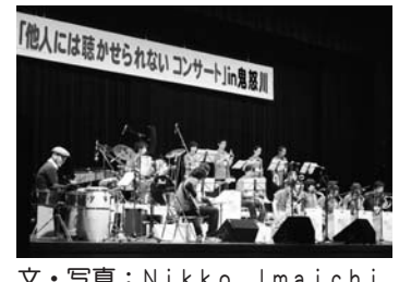
文・写真：Nikko Imaichi Swing m Orchestra(ニスコイ)

他人には聴かせられないコンサート 2/26 藤原 このコンサートは、素人バンドの「まだ他人には聴かせられないが発表の場がほしい」との思いから東京の日本青年館で開催されています。今回は鬼怒川温泉の活性化を目指し、藤原総合文化会館で初開催。東京から来た演奏者の方々には演奏と観光を楽しんでもらいました。 今後は、毎年開催していきたいと思えます。