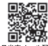
日光市メール配信QRコード

配信項目(配信日)：市政情報・観光イベント情報(10日、25日の毎月2回)、消防出動情報(随時) ※メールを受信するための通信料は利用者負担 聞：秘書広報課 ☎(21) 5135