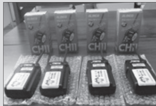
小電力トランシーバー

防災資機材を整備しました (財)自治総合センターでは、市町村やコミュニティ組織に対して宝くじの売上金の一部を助成する事業を行っています。この助成事業は、コミュニティの健全な発展と自治宝くじの普及広報を目的としています。 市ではこの助成を受け、和泉自主防災会、裏見台自治会自主防災会、細尾町自主防災会、瀬川町自主防災会、山口自主防災会に消火器や小電力トランシーバーなどの防災資機材を整備しました。 皆さんで大切に使用し、地域の防災力を高めましょう。 問：総務課 ☎(21)5130