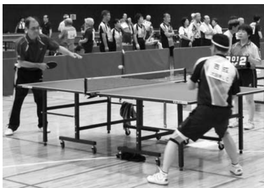
昨年開催したリハーサル大会の様子