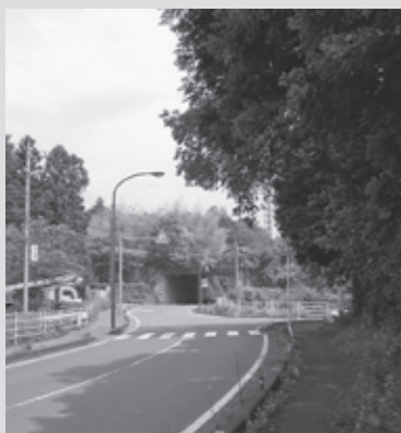
道路上に木が生い茂っている様子

くわしくは 国道・県道について 県日光土木事務所 保全部 ☎(53) 1 2 2 1 市道について 維持管理課 ☎(21) 5 1 6 0 ◎産業建設課 ☎(54) 1 1 1 4 ◎産業建設課 ☎(76) 4 1 0 7 ◎産業建設課 ☎(93) 3 1 1 7 ◎産業建設課 ☎(97) 1 1 3 3