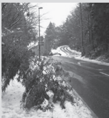
樹木が歩道に倒れている様子