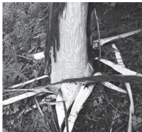
クマによる皮剥ぎ被害