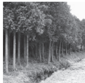
猪倉整備地の様子