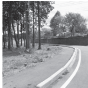
芹沼整備地の様子