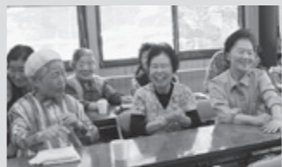
野の花での活動の様子

7年前から週1、2回通っています。とても楽しく、のんびりと過ごしています。よい友達ができ、活性化されて若返ります。これからもずっと通っていきたくです。