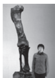
カマラサウルスの後ろ足

物食恐竜から始まりましたが、植物食恐竜を食べる肉食恐竜もまた大型化していきました。 大型化の一方で、周囲を海に囲まれた狭い土地にすむ恐竜は、少ない餌に対応できるように小型化しました。また、環境変化に伴う餌不足の際には、小型の恐竜の方が有利でした。