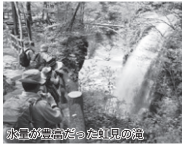
水量が豊富だった虹見の滝