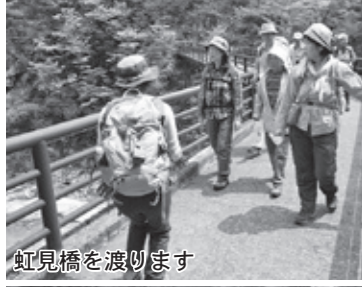
虹見橋を渡ります