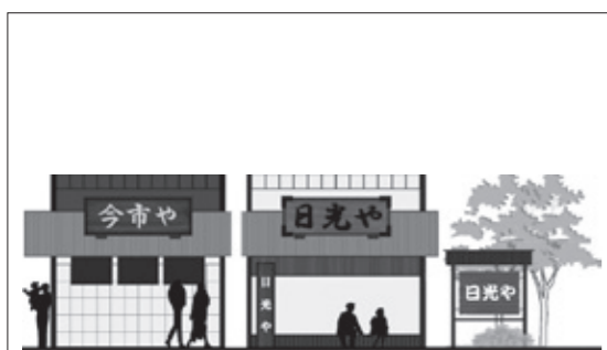
図：自家用広告物の表示例

同じ敷地内に表示した、全ての広告物の表示面積の合計が10㎡以内の場合、許可は不要ですが、その規格は設置場所における許可基準に適合させる必要があります。自家用広告物も良好な景観づくりのための大きな要素となりますので、ご協力をお願いします。