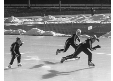
文・写真：学校教育課

小学生氷上体育大会 【2/5 日光】 県スケート連盟の協力を得て、日光霧降スケートセンターで開催しました。市内13小学校の4・5・6年生30人が、100m・500m・800mリレーに挑戦。声援の中、転んでも最後まで滑る子どもたちの姿に、会場は熱気に包まれました。 今大会では、5つの大会新記録が誕生し、うち2つの種目では、22年ぶりに記録が更新されました。