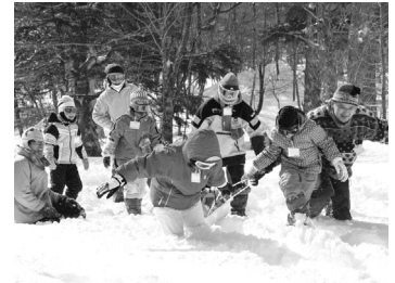
文・写真：日光自然博物館

親子で雪の運動会 【1/27 日光】 穏やかな晴天に恵まれた奥日光湯元温泉に、7組26名の親子が集まりました。たっぴりの雪の中、2チームに分かれて「雪だるまさんがころんだ」や「雪ざり・手つなぎリレー」、人気のスノーシューを履いて競争する「スノーシューでドン！」などの競技を行い、雪にまみれて思いっきり遊ぶ冬の楽しさを堪能しました。