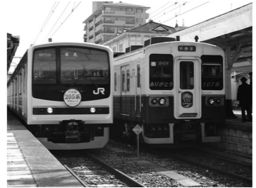
文・写真: JR東日本大宮支社

3月16日(土)のデビューに先立ち、日光線用26系リニューアル車両の展示会を、日光駅で開催しました。当日は少し寒かったですが、大勢の家族連れや鉄道ファンでにぎわいました。これまで日光線で活躍してきた107系電車同様、新しい26系電車もぜひかわいがってください。