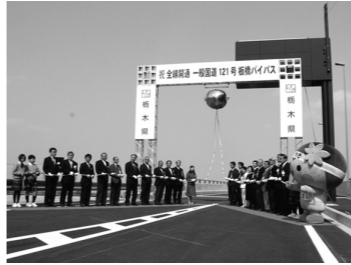
文・写真: 秘書広報課

土沢インターチェンジ入口交差点で、板橋ハイパス全線開通式典が行われました。式典では、県知事が式辞を述べ、南原小学校ブラスバンド部の演奏などが行われました。また、通り初め式では、テープカットやくす玉開きが行われ、観客から喝采を浴びました。