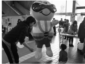
文・写真: 生涯学習課

約400人が来場した「日光学まつり・生涯学習フェスタ」では、「子育てあるある川柳」などの展示や「日光きらり発表会」、「子どもフリーマーケット・楽市楽座」などが行われました。来場者からは、「手話を入れたコースは、有意義な試みだと思えます。ぜひ、継続してください」などの感想をもらいました。