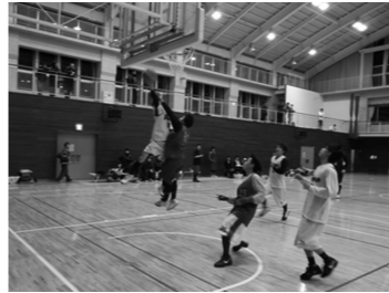
文・写真: バスケットボール部事務局

市体協バスケットボール部主催の市民バスケットボール大会「まりもリーグ」は、今年で4回目を迎えました。この大会は、勝つこと以上に、バスケットボールを通して交流を深めるという大きな目的があります。参加資格はバスケットボールが大好きな子ども。来年も多くの方の参加をお待ちしています。