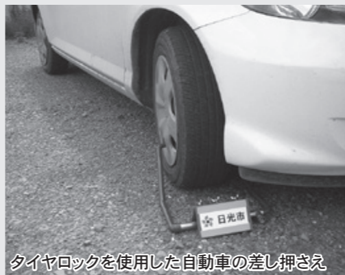
タイヤロックを使用した自動車の差し押さえ

個人事業者や法人の場合は、売掛金などの差し押さえのため、取引先への調査を行います。 差押処分 不動産や預貯金、生命保険、給与、自動車などの差し押さえを行います。差し押さえ後も納付されない場合、差し押さえ財産の公売や取り立てを行います。 ※特に強化月間中は、納付意思のない滞納者に対して、住居や事業所の捜索、自動車差し押さえのためのタイヤロックなどを実施します。