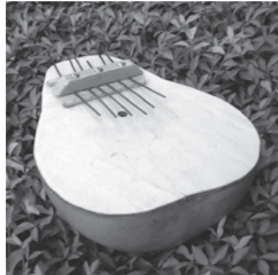
こんなにかわいい楽器ができます。