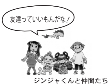
ジンジャクんと仲間たち