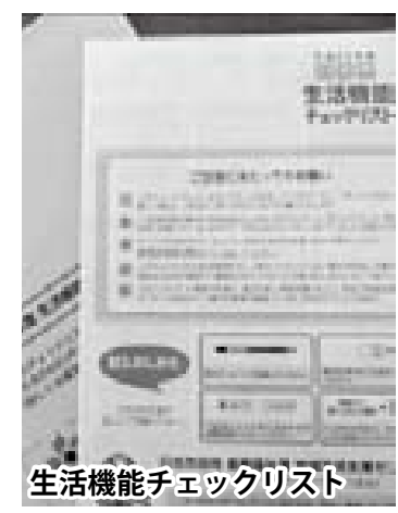
図：平成26年度生活機能チェックリストの結果

今年も「つ」が通じ 今年は質問項目を増やし、より細やかなチェックができる内容となりました。 くわしくは 高齢福祉課 地域包括支援センター ☎(21)2137