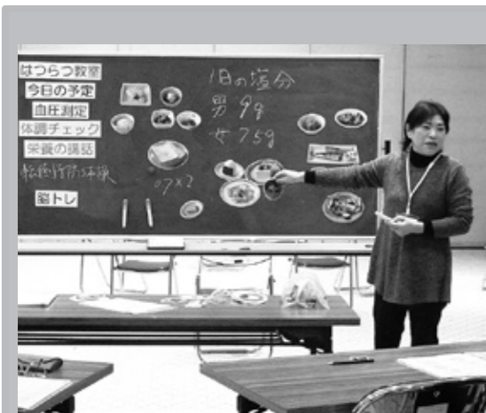
栄養講話！ 毎日の食事を振り返りながら行います