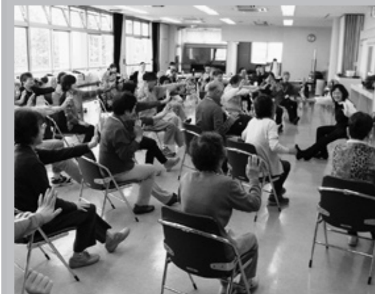
転ばないための転倒予防体操！ 椅子に座って楽しく体操します

◆元気なうちから介護予防 いつまでも生き生きとした生活を送るためには、元気なうちから介護予防が必要です。 そのためには、心身の老化を防ぐことが重要です。 具体的には、次の6項目について取り組むことが必要です。