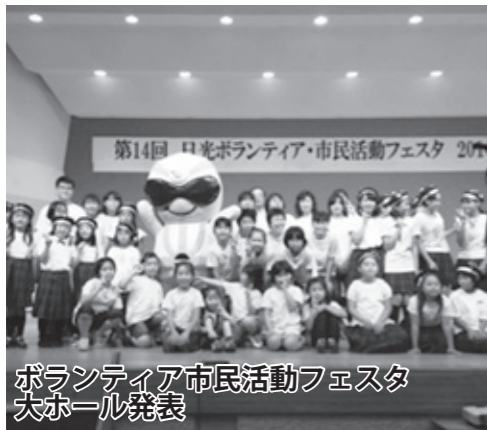
ボランティア市民活動フェスタ 大ホール発表

日光市民活動支援センター(以下、センター)の活動を紹介します。 センターは、営利を目的としない社会貢献活動を行う市民団体が、会議や情報交流の場として無料で使用することができる施設です。 また、センター職員によるボランティア活動やNPO法人設立に関する相談も行っています。 場所は、今市小学校に隣接しています。現在は、親子サークルやNPO法人など、100を超える市民団体がセンターを利用しています。 センターの魅力の一つに建物内の市民団体活動展示スペースがあります。