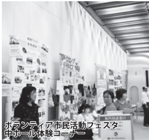
ボランティア市民活動フェスタ 中ホール体験コーナー