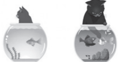
ストレスなどの状況で変化する水槽