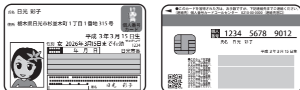
個人番号カード(イメージ)

ICチップのついたカードの表面に、氏名・住所・生年月日・性別・有効期間・顔写真が掲載され、裏面にマイナンバーが記載されます。