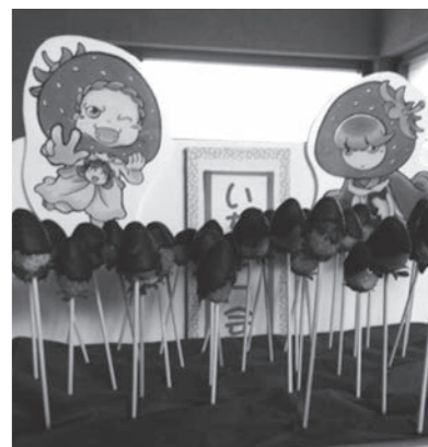
チョコがけイチゴによるおもてなし