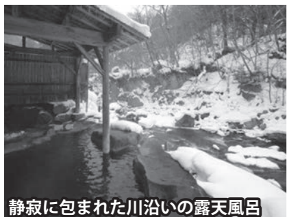
静寂に包まれた川沿いの露天風呂

また、山や川の幸、そば、ばんだい餅など、地理的な特徴を生かした料理や、人との出会いなど、田舎ならではのおもてなしを受けることができるのも川俣温泉の魅力です。