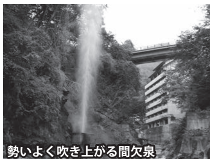
勢いよく吹き上がる間欠泉

また、山や川の幸、そば、ばんだい餅など、地理的な特徴を生かした料理や、人との出会いなど、田舎ならではのおもてなしを受けることができるのも川俣温泉の魅力です。