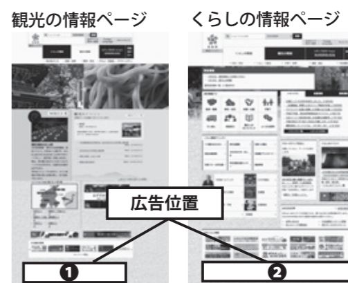
図1：ホームページのバナー掲載位置