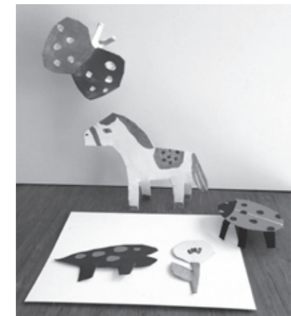
ワークショップ参考作品

所・問…小杉放菴記念日光美術館 ☎50-1200 (午前9時30分～午後5時開館(入館は午後4時30分まで))