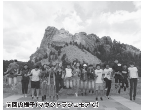
前回の様子(マウントラッシュモアで)