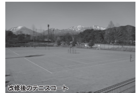
改修後のテニスコート