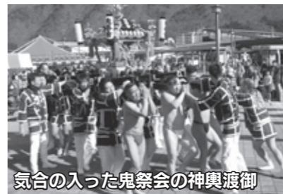
気合の入った鬼祭会の神輿渡御

鬼怒川温泉春節・鬼まつり 2月2日(土)・3日(日)、鬼怒川温泉駅前広場で旧正月と節分を祝う「鬼怒川温泉春節・鬼まつり」が開催されました。龍王太鼓保存会による大鼓の演奏でスタートしたまつりは、大ガラムキ大会や猿まわし公演などが行われた他、人力車の無料試乗や忍者手裏剣・射的体験など文化体験ができるコーナーや、そばやコ