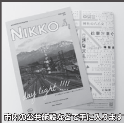
市内の公共施設などで手に入ります

なお、ドキュメンタリー映像や誌面で紹介しきれなかった内容をWEBマガジン版「NIKKO」で紹介しています。詳しくは、専用ホームページ( https://nikko-3rd-place.info )をご覧ください。