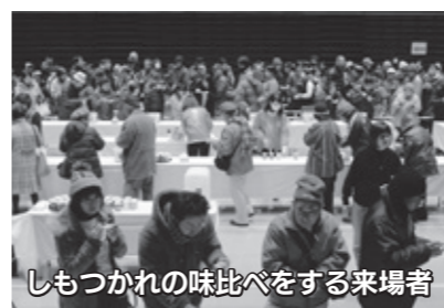
しもつかれの味比べをする来場者