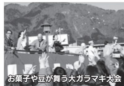
お菓子や豆が舞う大ガラムキ大会