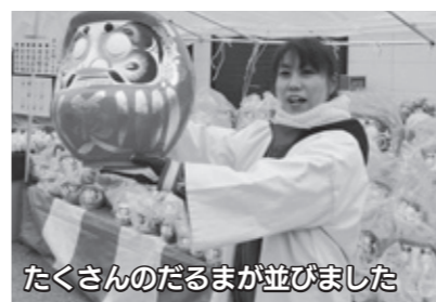
たくさんのだるまが並びました

また、ニコニコ本陣では、19回目となる「全日本しもつかれコンテスト」および、茨城県日立市の海産物などが味わえる「日立のう