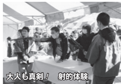
大人も真剣！ 射的体験