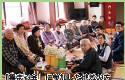
「集まる会」に参加した地域の方