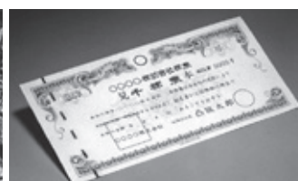
有価証券など 131億5,019万円