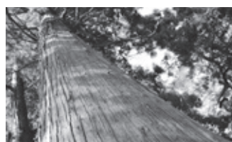
立木 日光街道杉並木に属する杉10本