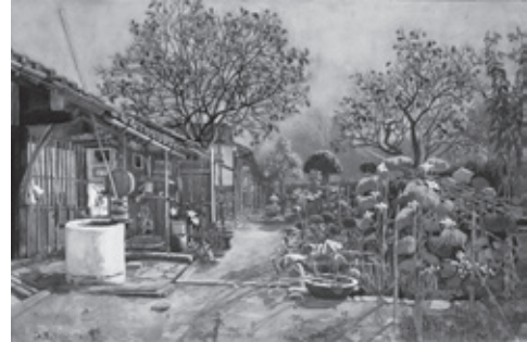
吉澤儀造「秋の庭」(1895～1903年頃作) 小杉放菴記念日光美術館蔵