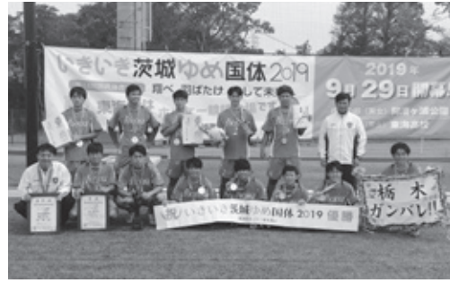
成年男子の部で優勝した栃木県(選抜) 2年ぶり2度目の優勝

9・10月に茨城県で開催された第74回国民体育大会「いきいき茨城ゆめ国体2019」のホッケー成年男子の部で、「LIBE 栃木」を中心とする栃木県(選抜)が優勝し、少年男子の部では栃木県代表の今市高等学校ホッケー部が優勝しました。