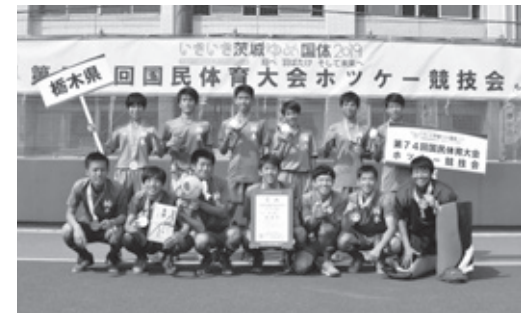
少年男子の部で優勝した今市高等学校ホッケー部 4年ぶり3度目の優勝