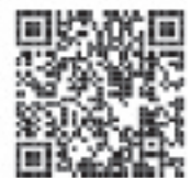
とちぎ結婚支援センターのQRコード