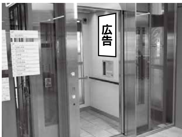
本庁舎エレベーター内壁面(A1縦サイズ)