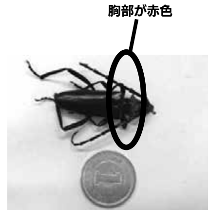
※栃木県ホームページより