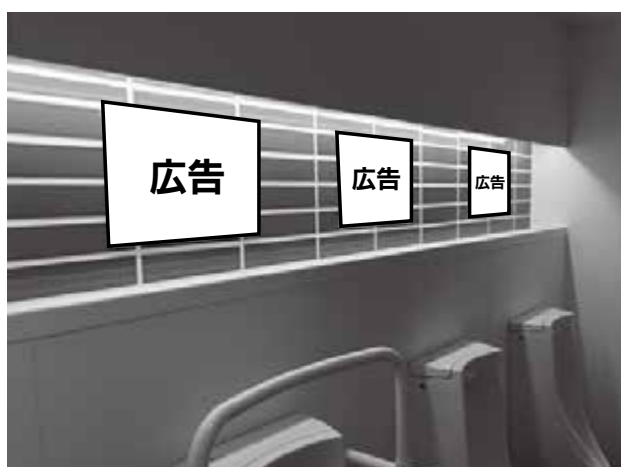
本庁舎1階男性用トイレ内壁面(A3横サイズ)