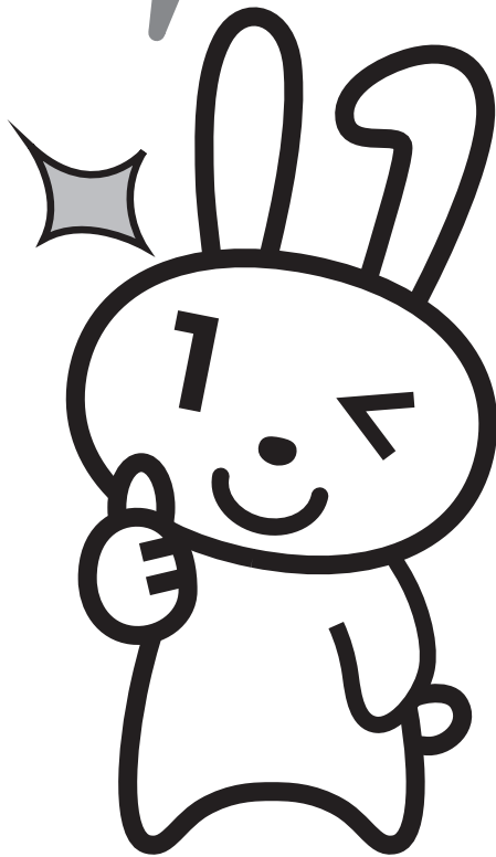
マイナンバー PR キャラクター マイナちゃん