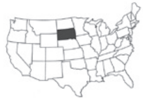
サウスダコタ州の位置

今回は皆さんに少しでもラピッド市のことを知ってもらえるよう市の様子をご紹介します。