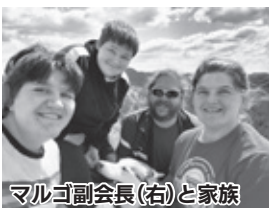
マルゴ副会長(右)と家族

日光の親愛なる友達皆さん、こんにちは！ラピッドは典型的な夏です。毎日暖かく晴れ、夕方は涼しく、景色は美しいです。