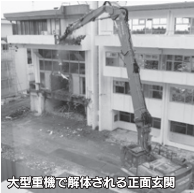
大型重機で解体される正面玄関